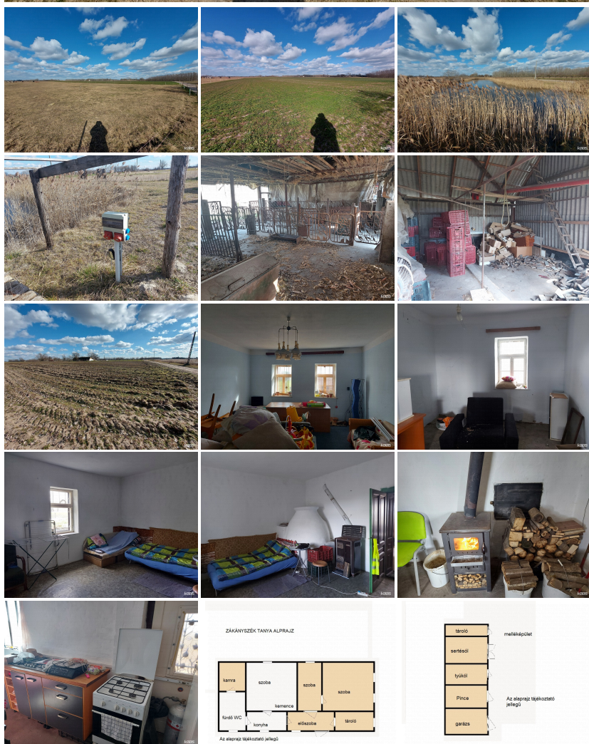
ZÁKÁNYSZÉK TANYA ALPRAJZ

Az ingatlan mindig járható földút mellett található, négy irányból megközelíthető. A Birtok kiválóan alkalmas egy nagyobb család ellátására, annak munkahelyet tud a háznál biztosítani, intenzív kertészet és állattartás