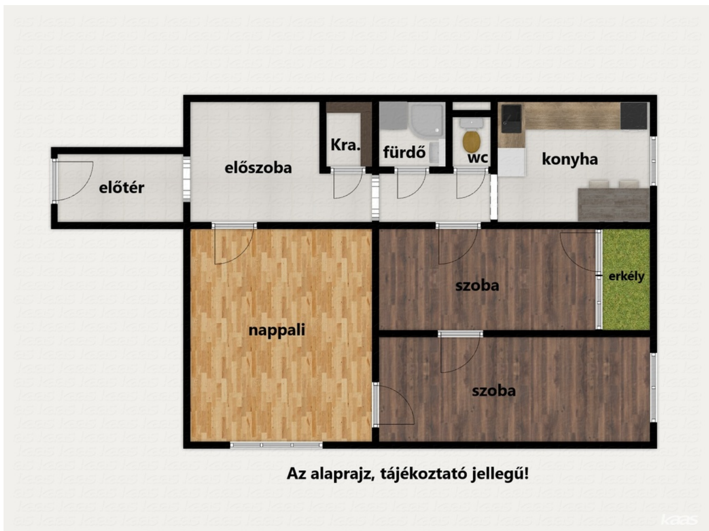
Az alaprajz, tájékoztató jellegű!

További tulajdonságok felsorolása: [69 m 2 alapterületű] [3 szobás] [10 emeletes épületben] [1 szintes ingatlan] [2011 évben felújítva] [250 cm belmagasságú] [vasbeton falazatú] [nemes vakolatos] [műanyag ablakok] [panel bejárati ajtók] [panel belső ajtó] [műanyag redőny] [kerámialap padlózatú] [laminált parkettás] [lift jól karbantartott] [korszerűsített felvonó] [energiatakarékos világítású] [jó állapotú lakás] [nappalival] [gardróbbal] [előtérrel] [közlekedővel] [több hálósobával] [külön fürdőszoba, wc] [külön konyha, ebédlő] [gáztűzhellyel] [erkély, balkon, loggia] [összkomfortos] [távfűtésű] [radiátoros] [parkolás közterületen] [buszmegálló közelben] [lakás] [alacsony fűtés költség] [3 hónap és beköltözhető] [délkeleti tájolású]