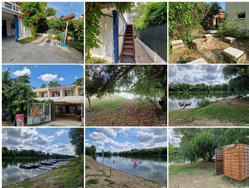
Kaas a Tudatos Otthonteremtő